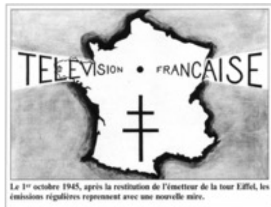
Le 1 er octobre 1945, après la restitution de l'émetteur de la tour Eiffel, les émissions régulières reprennent avec une nouvelle mire.

Après restitution de l'émetteur de la Tour Eiffel, les émissions régulières reprennent avec une nouvelle mire. Elles sont diffusées depuis les studios de la Rue Cognacq-Jay .